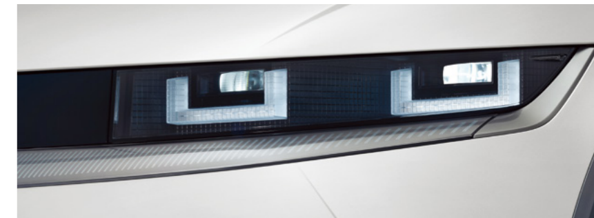
תאורת LED קדמית