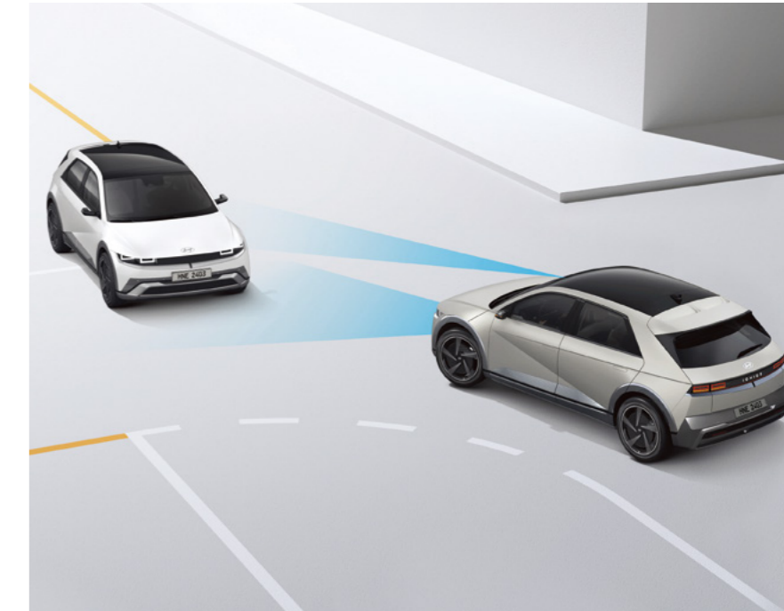
בלימה אוטונומית במצבי חירום (FCA-JT)

מערכת אקטיבית המסייעת בשמירה על מרכז נתיב הנסיעה.