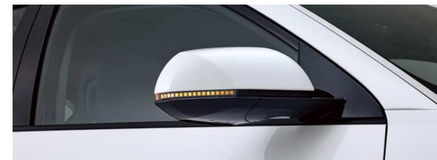
פנסי איתות במראות LED