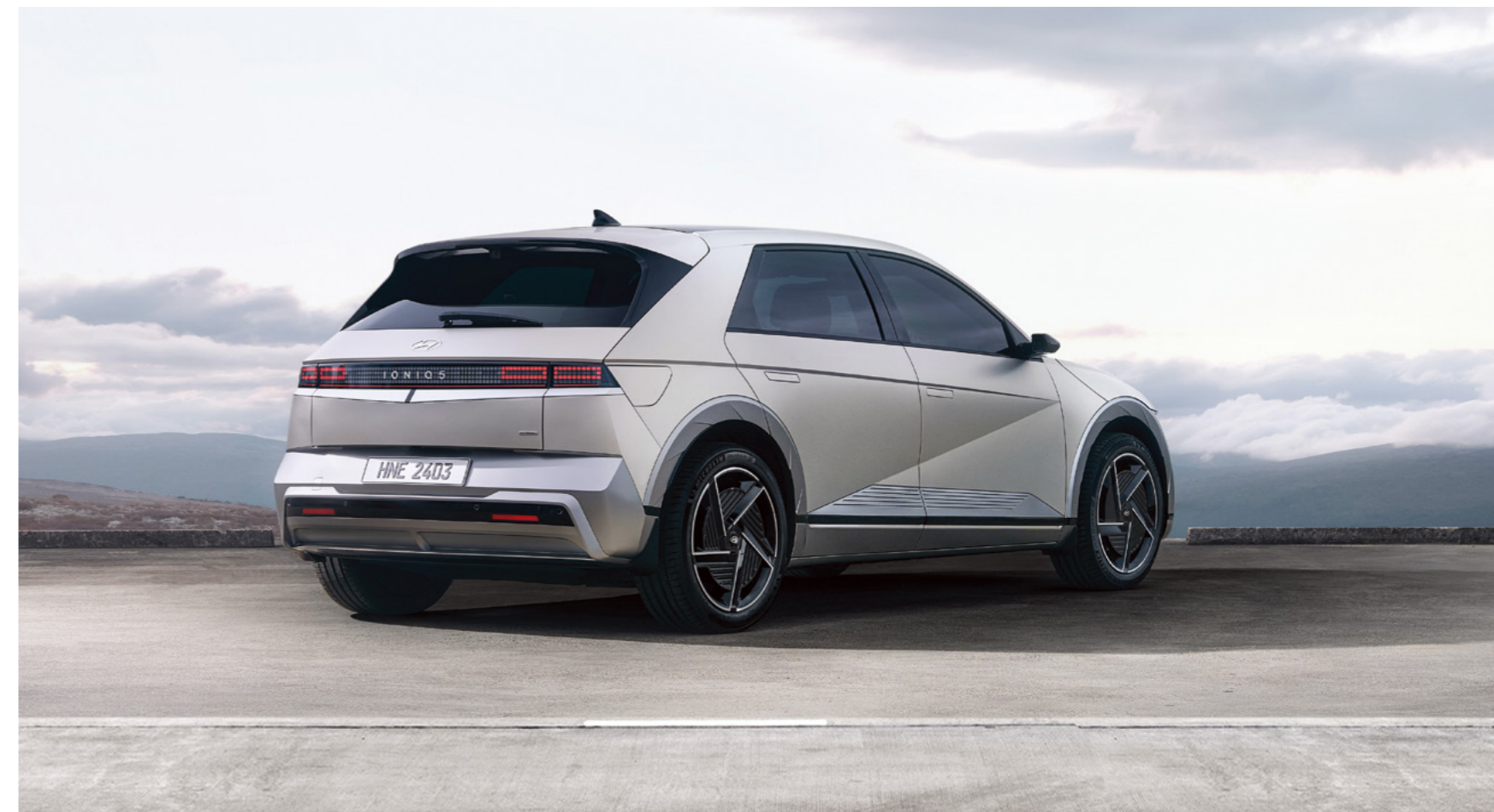
פגוש אחורי רחב בשילוב פנסים בטכנולוגיית LED

עיצוב הפגוש האחורי בשילוב פנסי ה-LED והספילר מעניקים ל-IONIQ 5 מראה חלק.