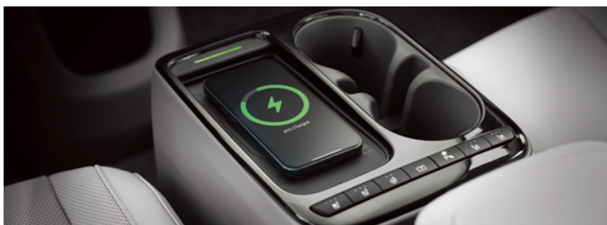
טעינה אלחוטית לנייד (לטלפונים התומכים בטכנולוגיית Qi)*