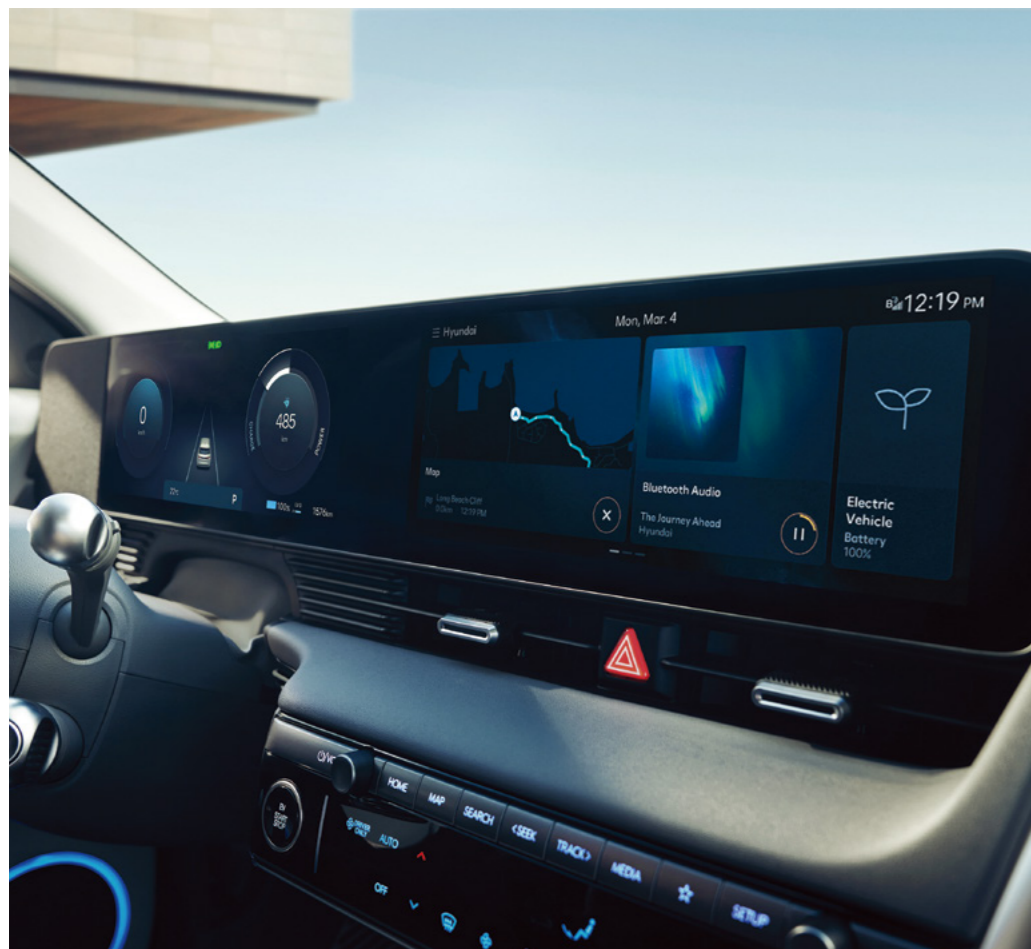
צג רחב המשלב מערכת מולטימדיה ולוח מחוונים בגודל 12.3"

יונדאי IONIQ 5 משדרגת את היום-יום שלכם. השילוב בין יכולות דיגיטליות מתקדמות ופונקציונליות המציעים נוחות אינטואיטיבית.