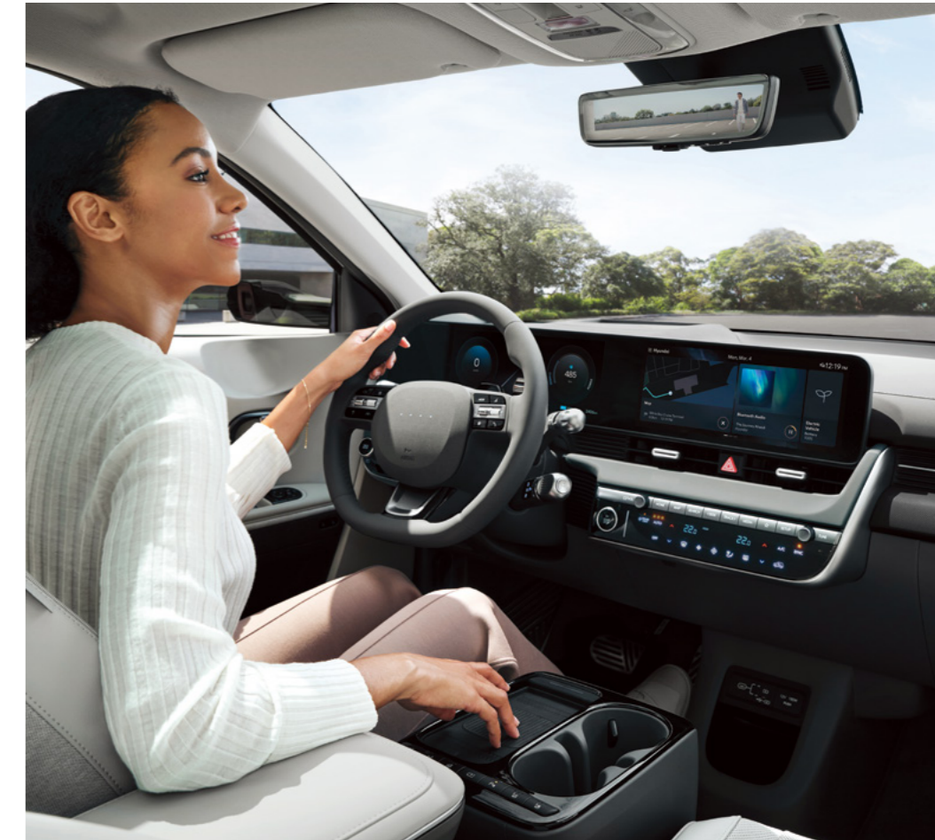
מראה מרכזית מתכהה נגד סינוור *ECM