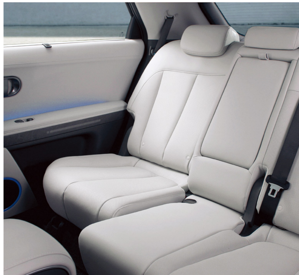
מושב אחורי עם אפשרות לכיוון חשמלי*