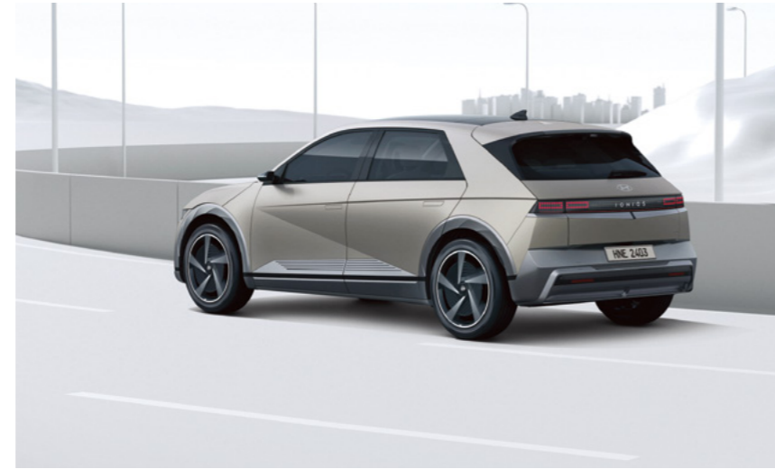
בקרת שיוט חכמה הכוללת מנגנון זחילה בפקקים (SCC)

מערכת אקטיבית הכוללת תיקון הגה לסיוע בשמירה על נתיב הנסיעה. כאשר המערכת מזהה סטייה מנתיב הנסיעה, היא מבצעת תיקון הגה אוטומטי בכדי למנוע את הסטייה מנתיב הנסיעה.