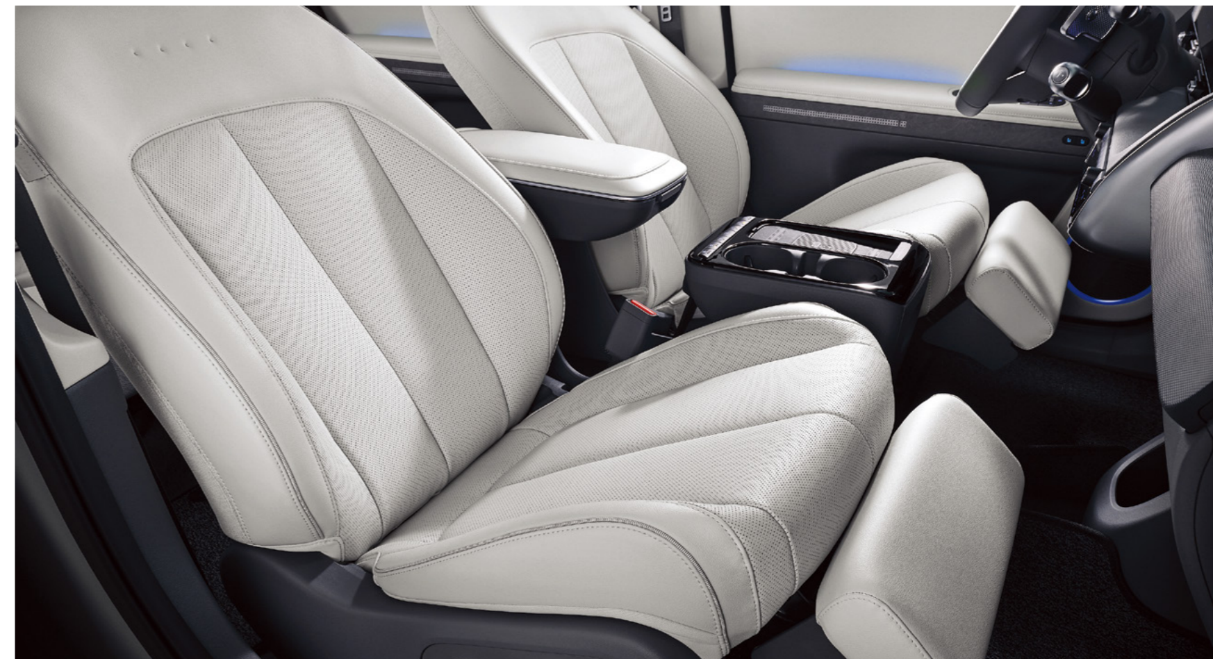
Relaxation Seat מושבים קדמיים מתכווננים הניתנים להטיה מלאה*