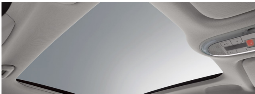
גג שמש פנורמי*