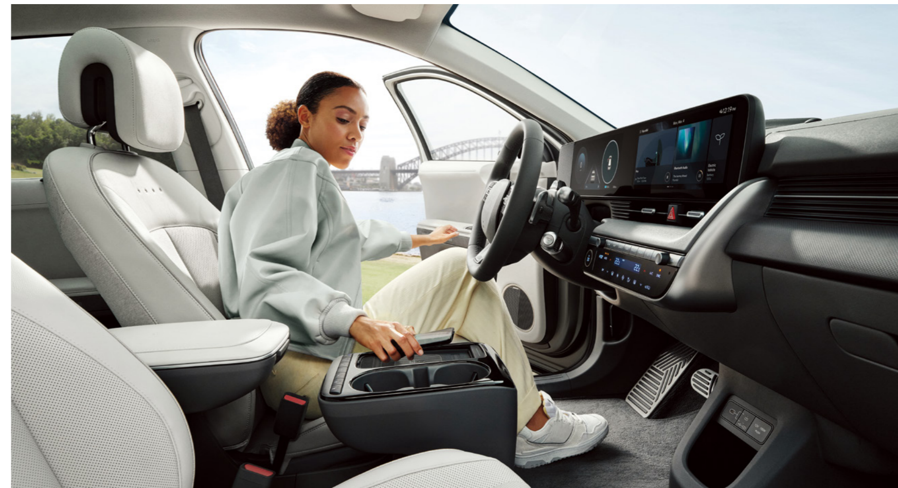
קונסולה מרכזית צפה הניתנת להזזה עד 14 ס"מ, בשילוב משטח טעינה אלחוטי** ולחצן לחימום ואוורור מושבים קדמיים*.