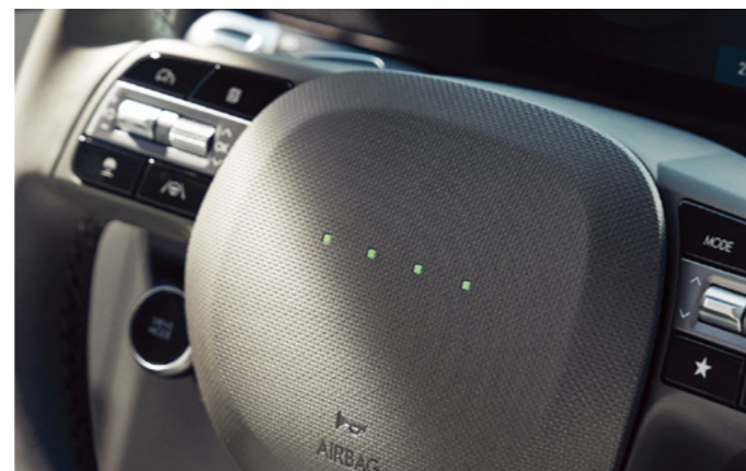
תאורת פיקסלים אינטראקטיבית המופיעה בעת הפעלה, נסיעה לאחור וטעינה.