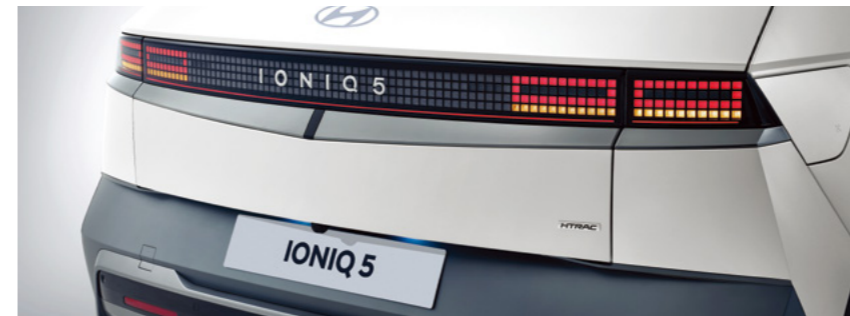
תאורת LED אחורית