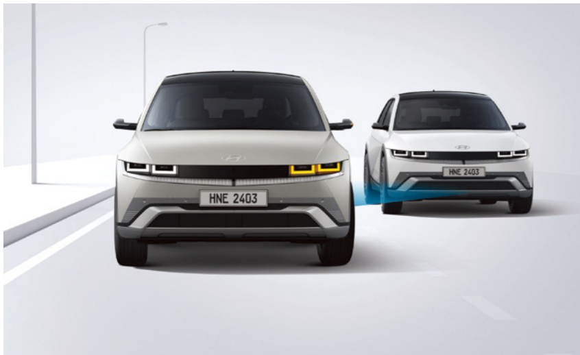
מערכת אקטיבית לזיהוי ומניעת התנגשות בכלי רכב ב"שטח מת" (BCA)

מערכת מבוססת רדאר המתריעה על רכבים ב"שטח מת" בעת מעבר נתיב ומבצעת תיקון הגה אוטומטי במידה והנתיב אינו פנוי.