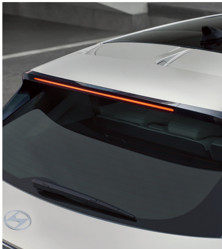
ספילר אחורי אווירודינמי בגג