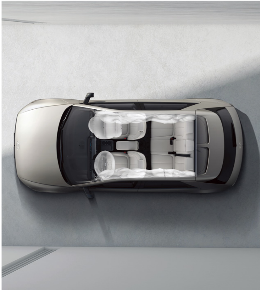
7 כריות אוויר

טכנולוגיות מתקדמות מספקות הגנה מרבית המאפשרת לכם ליהנות מחוויית נסיעה רגועה יותר ובטוחה יותר.