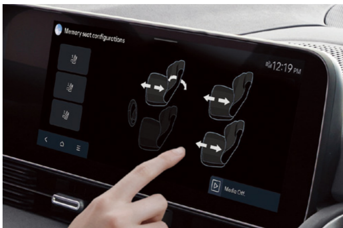
כיוון מושבים חשמלי ממסך המולטימדיה*

שילוב חומרים יוקרתיים בעיצוב מינימליסטי מעניק לכם נוחות מקסימלית בחלל הפנים.