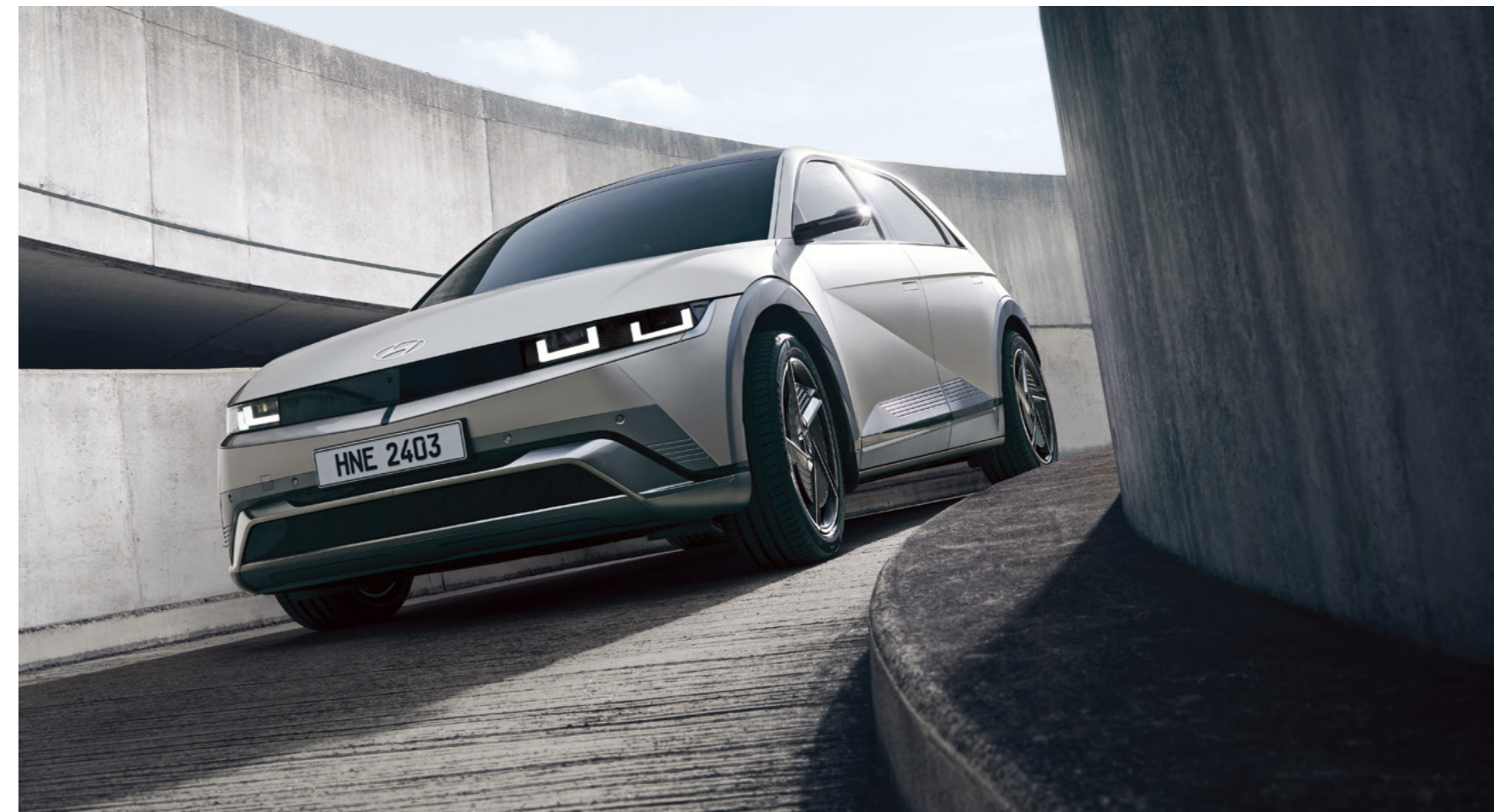
פגוש קדמי רחב המשלב פנסי LED