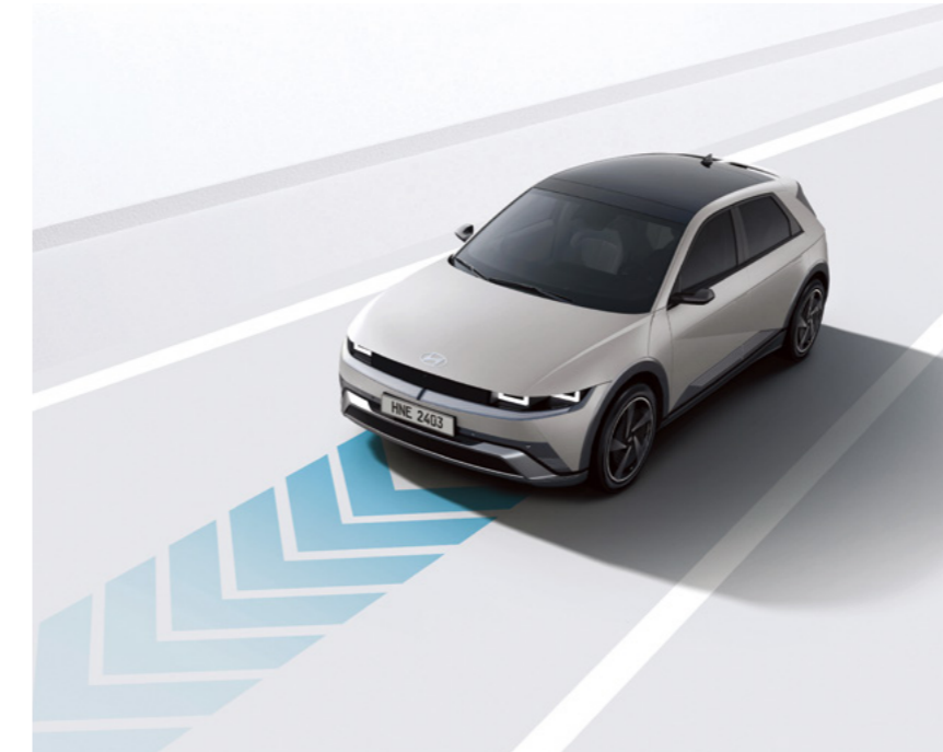
מערכת סיוע לשמירה על מרכז נתיב הנסיעה (LFA)

מערכת מבוססת רדאר המתריעה על רכבים ב"שטח מת" בעת מעבר נתיב ומבצעת תיקון הגה אוטומטי במידה והנתיב אינו פנוי.