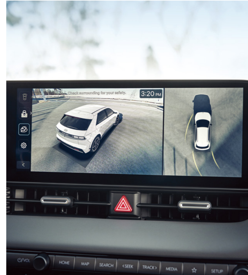
מערך מצלמות היקפי (SVM)*