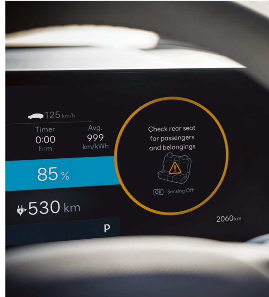
חיווי תזכורת על שיכחת ילד/נוסע במושב האחורי (ROA)