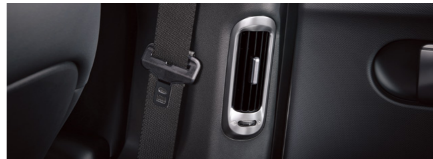
פתחי מיזוג אוויר למושב האחור