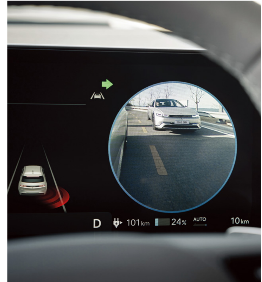
הצגת צילום חי של "שטח מת" על גבי לוח המחוונים הדיגיטלי בעת הפעלת איתות (BVM)*