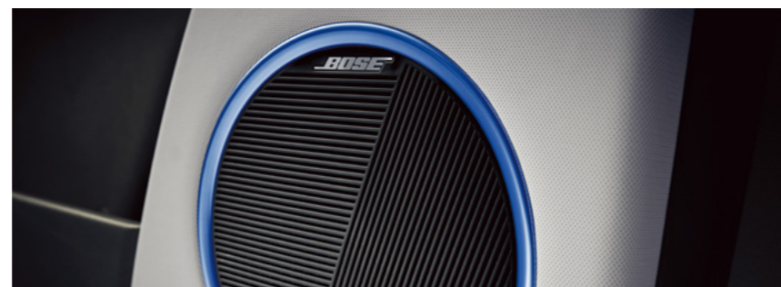
מערכת שמע מבית BOSE*