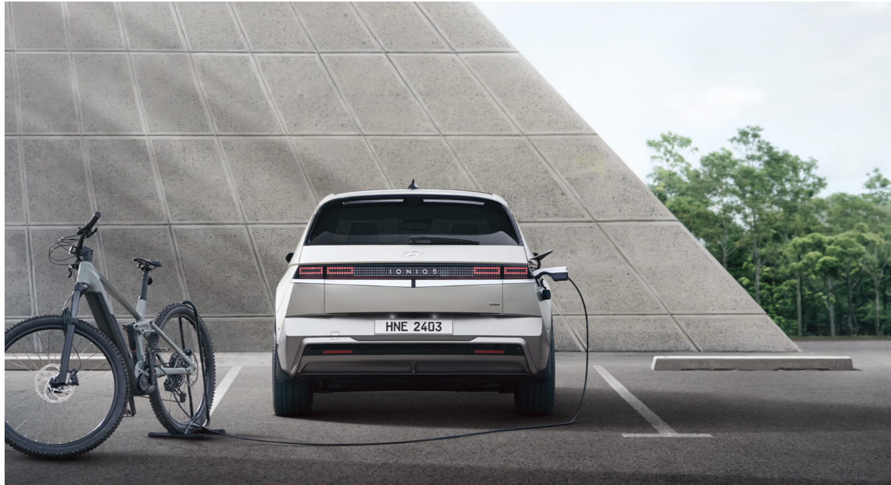
אפשרות לטעינה חיצונית של מוצרי חשמל V2L (אביזר בתוספת תשלום)

מגוון אלמנטים חדשניים ושימוש בטכנולוגיות חכמות ומתקדמות.