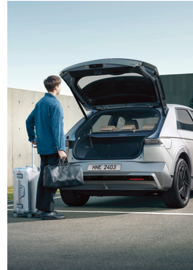
דלת תא מטען חשמלית חכמה עם אפשרות לכיוונון גובה ומהירות*