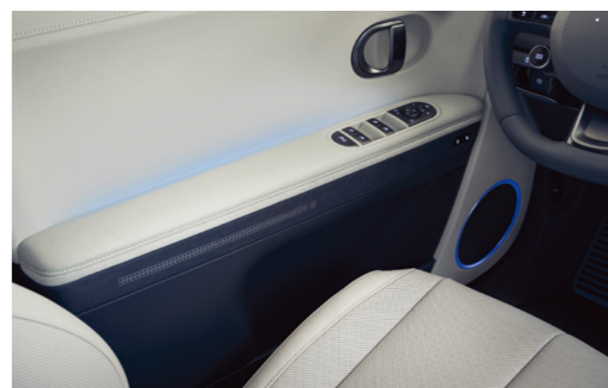
תאורת אווירה משתנה*