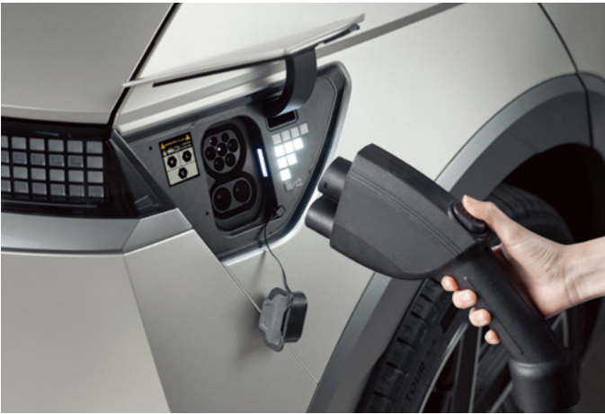
פתח טעינה חשמלית ותאורת פיקסלים המראה את מצב הסוללה