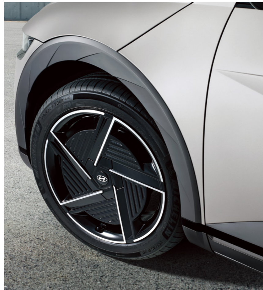
חישוקי סגסוגת 20"