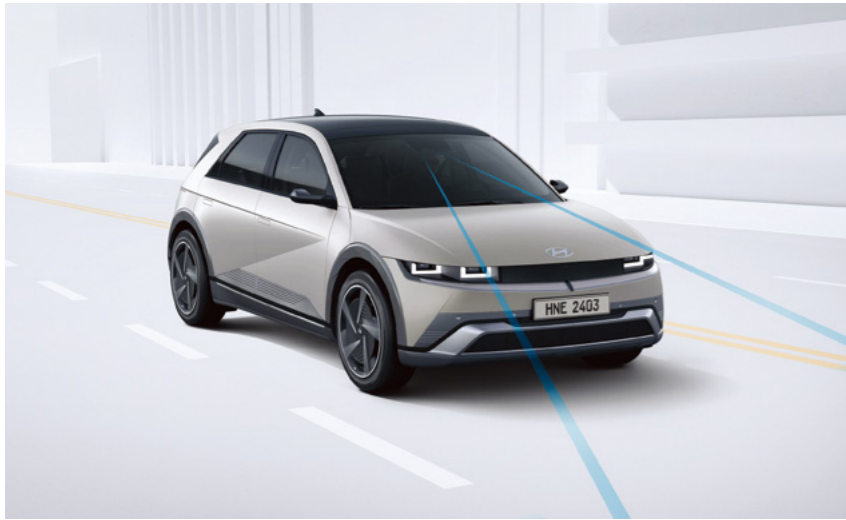
מערכת אקטיבית הכוללת תיקון הגה (LKA)

ליהנות ממערכות עזר וממערכות בטיחות ברמה הגבוהה ביותר. יונדאי 5 IONIQ צוידה במערכות הבטיחות ובמערכות העזר המתקדמות והחדשות ביותר כדי שתוכלו לנהוג בראש שקט.