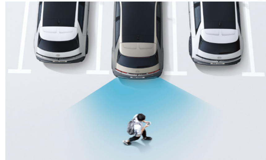
מערכת אקטיבית להתראה ומניעת התנגשות בעת כניסה ויציאה מחניה (PCA)*