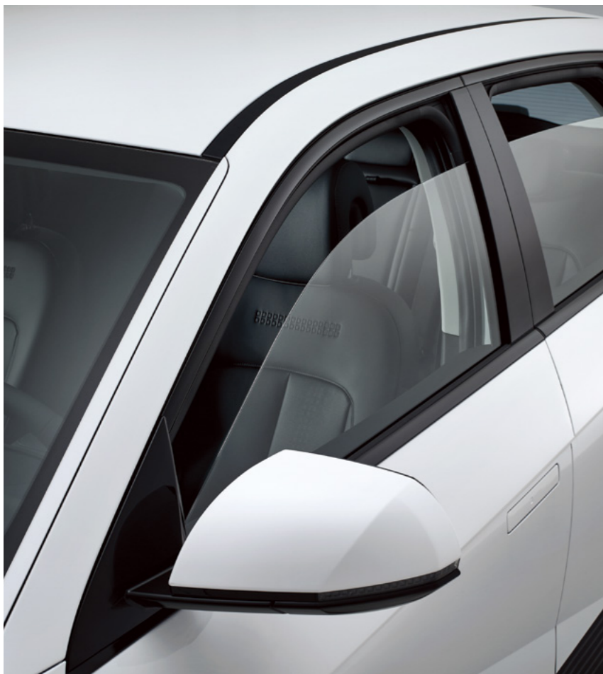
קיפול מראות חשמלי

כל מילימטר ב-IONIQ 5 טופל בקפידה, כולל פרטי הגלגלים, במטרה לחזק את העיצוב האייקוני ולשדרג את המאפיינים האווירודינמיים שלה.