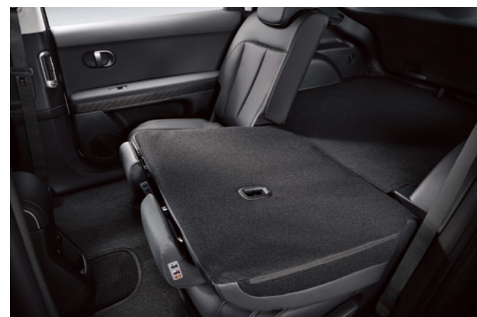
קיפול מושבים אחוריים