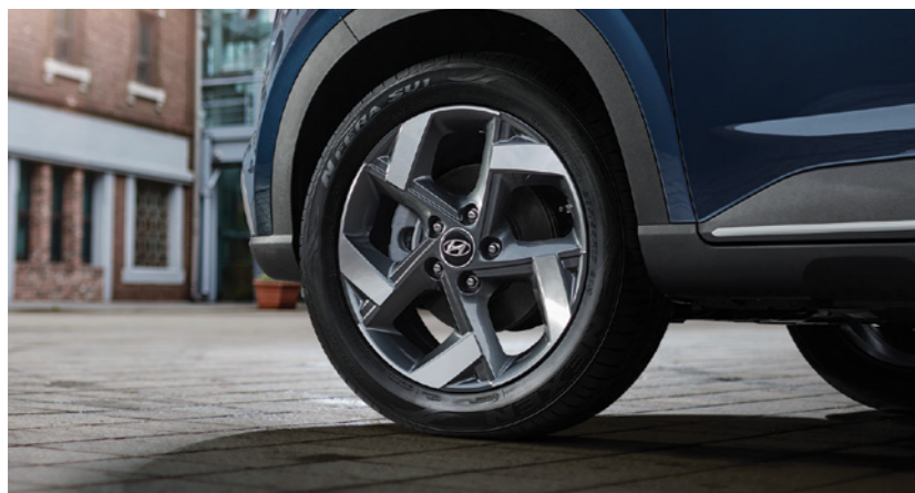
חישוקי סגסוגת "17"

יונדאי VENUE מסובב ראשים בכל פנייה. עם עיצוב חיצוני בולט הכולל גריל מעוצב עם עיטורי כרום* במראה אגרסיבי לצד פנסים מעודנים בקווים אלכסוניים.