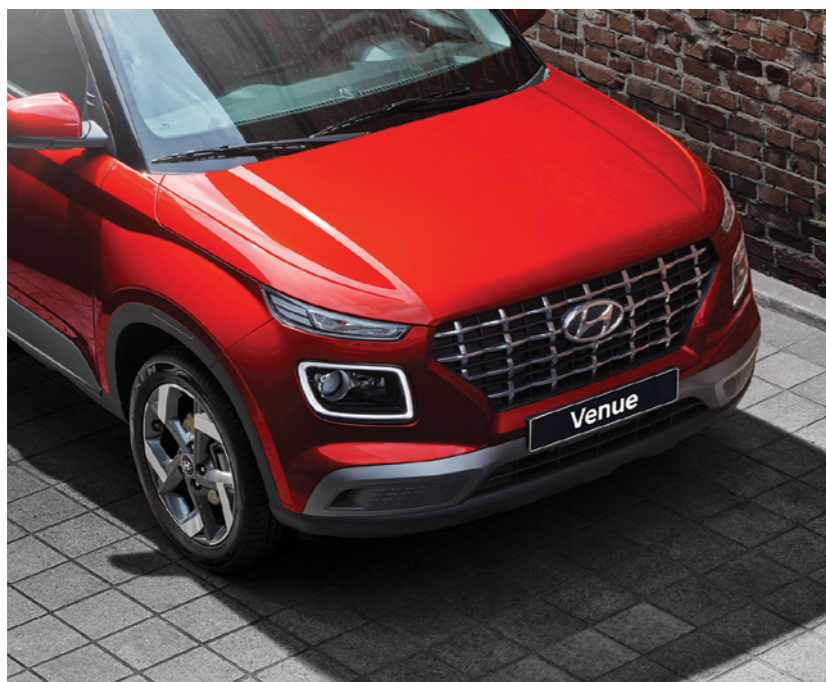
חזית במראה אגרסיבי עם גריל מעוצב*