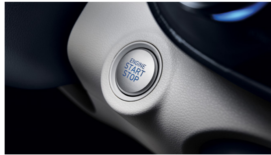
מפתח חכם - כניסה והתנעה ללא מפתח*