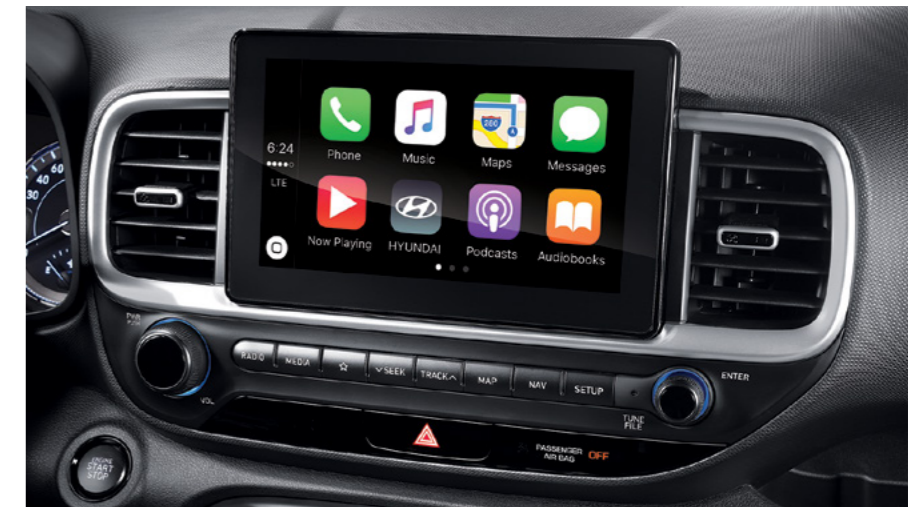
מערכת מולטימדיה מקורית 8" עם אפשרות חיבור למערכת Android Auto, Apple Carplay*