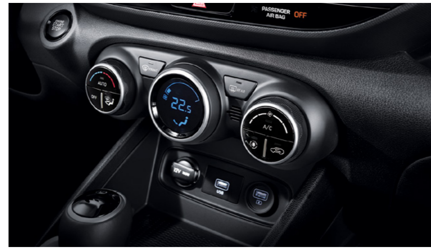
מערכת בקרת אקלים דיגיטלית**