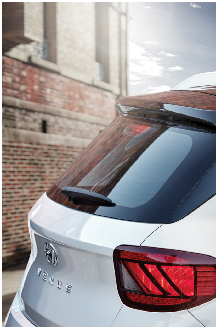
פנס אחורי בעל עדשה מעוצבת במראה אלכסוני