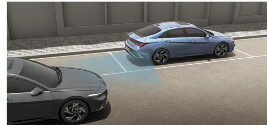
מערכת אקטיבית ליציאה בטוחה מהרכב (SEA)* מערכת "יציאה בטוחה" המתריעה ומונעת פתיחת דלתות המושב האחורי במקרה של רכב חוצה.