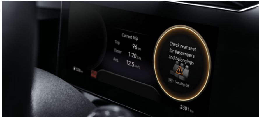
חיווי תזכורת למניעת שכחת נוסע במושב האחורי (ROA) מערכת ROA המתריעה על שכחת ילד/נוסע במושב האחורי.