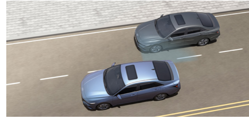
מערכת אקטיבית לזיהוי ומניעת התנגשות בכלי רכב ב"שטח מת" (BCA)* מערכת מבוססת רדאר המתריעה על רכבים ב"שטח מת" בעת מעבר נתיב ומבצעת תיקון הגה אוטומטי במידה והנתיב אינו פנוי.