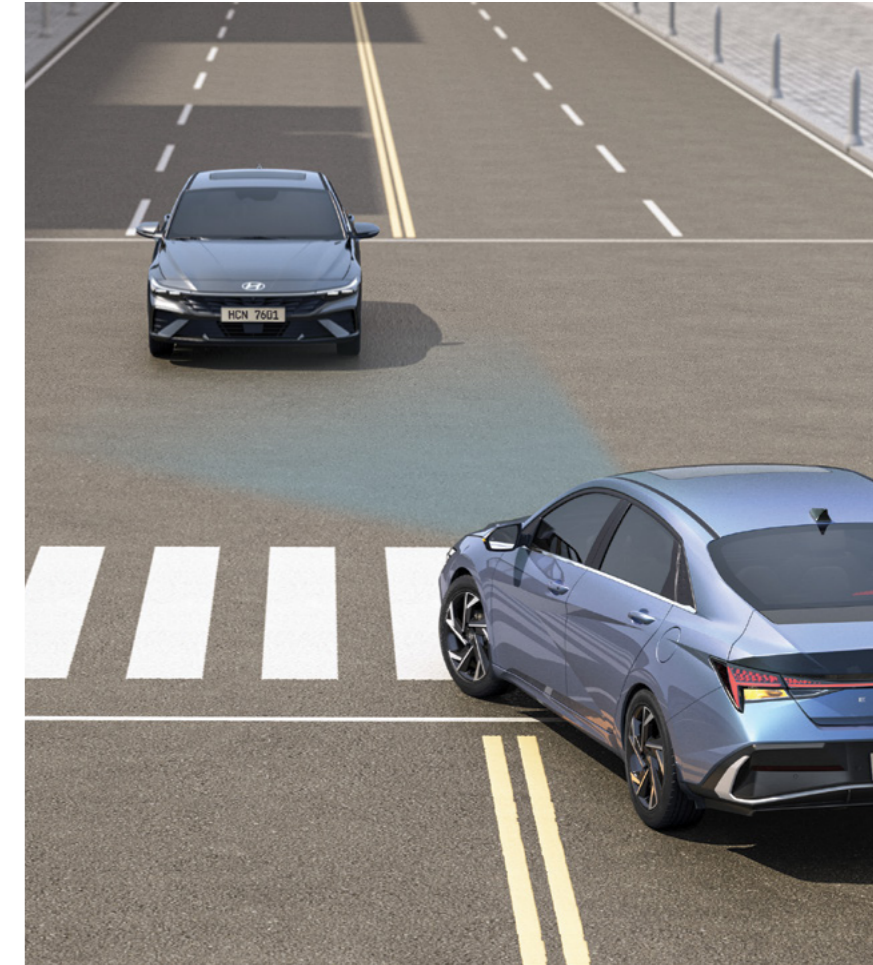
בלימה אוטונומית במצבי חירום (FCA-JT) מערכת אקטיבית המתריעה מפני סכנת התנגשות. במידה וסכנת ההתנגשות עולה לאחר ההתרעה, המערכת תבצע בלימת חירום אוטומטית. המערכת כוללת זיהוי כלי רכב, דו גלגלי ותנועה חוצה בצומת מכל הכיוונים.