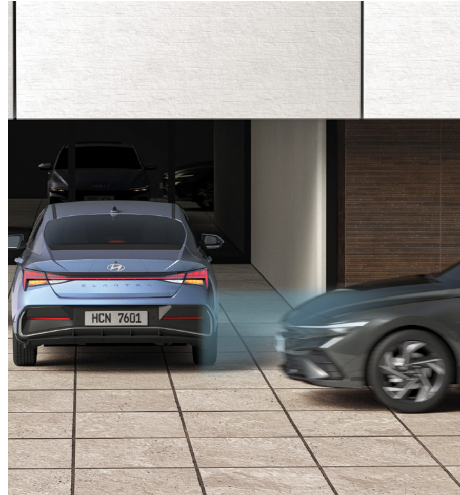
התרעה ומניעת פגיעה ברכב חוצה מאחור (RCCA)* מערכת אקטיבית למניעת פגיעה ברכב חוצה בעת נסיעה לאחור.