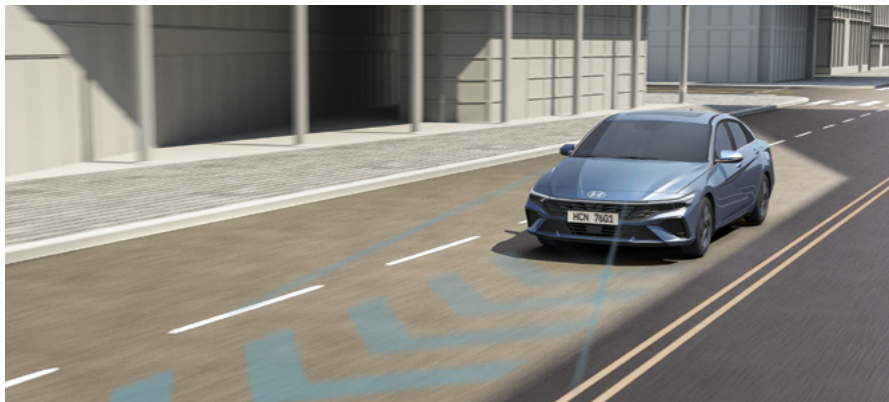
מערכת סיוע לשמירה על מרכז נתיב הנסיעה (LFA) מערכת אקטיבית המסייעת בשמירה על מרכז נתיב הנסיעה.