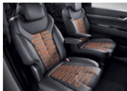
חימום מושבים קדמיים ואחוריים