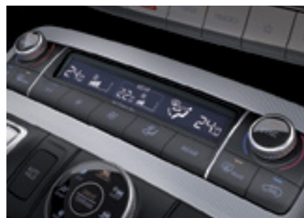
בקרת אקלים תלת איזורית