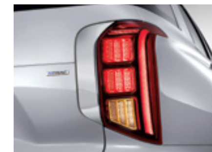
פנסים אחוריים LED