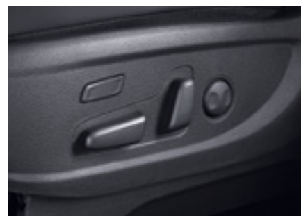
מושב נהג חשמלי