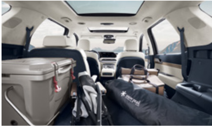
תא מטען מרווח (בקיפול מושבי השורה השלישית)