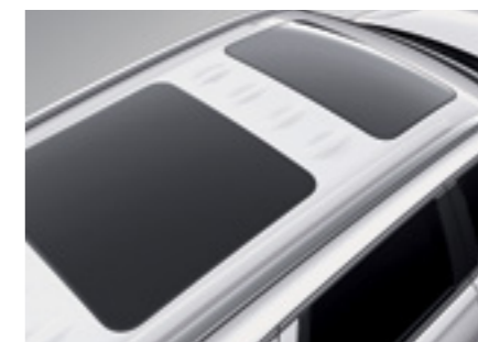
גג שמש פנורמי נפתח כפול*