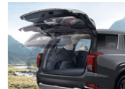
דלת תא מטען חשמלית חכמה