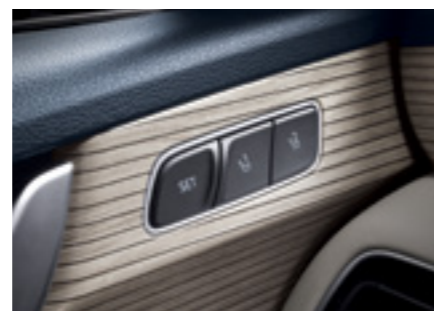
זכרונות למושב נהג*