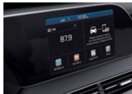
מערכת מולטימדיה עם מסך בגודל 8"