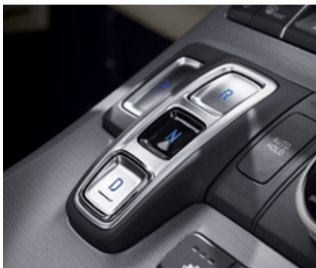
בחירת הילוך נסיעה בלחיצת כפתור (SBW)