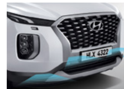
חיישני חניה קדמיים + אחוריים מקוריים