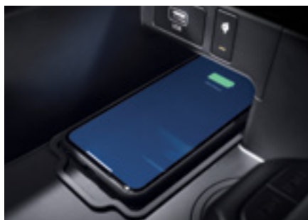
משטח טעינה אלחוטי