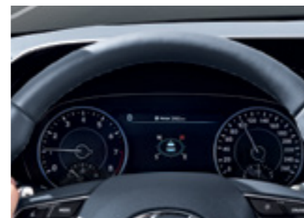
מסך TFT LCD בגודל 7"