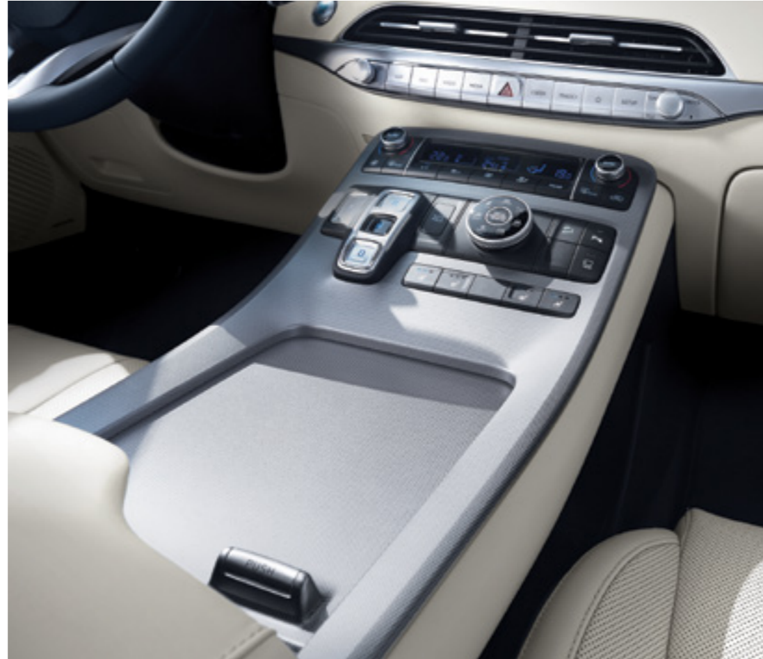
קונסולה גבוהה צפה

אם תעמדו ליד חלקו האחורי של הרכב למשך 3 שניות כאשר המפתח החכם נמצא אצלכם, דלת תא המטען תיפתח אוטומטית, כדי לאפשר לכם להוציא חפצים מהרכב בקלות ובנוחות. תוכלו לכוון את הגובה המקסימלי שבו דלת תא המטען תיפתח על ידי כוונת דלת תא המטען לגובה הרצוי ולחיצה על לחצן הסגירה והחזקתו לחוץ לפרק זמן מסוים.