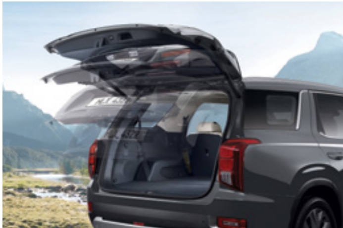
דלת תא מטען חשמלית חכמה

אם תעמדו ליד חלקו האחורי של הרכב למשך 3 שניות כאשר המפתח החכם נמצא אצלכם, דלת תא המטען תיפתח אוטומטית, כדי לאפשר לכם להוציא חפצים מהרכב בקלות ובנוחות. תוכלו לכוון את הגובה המקסימלי שבו דלת תא המטען תיפתח על ידי כוונת דלת תא המטען לגובה הרצוי ולחיצה על לחצן הסגירה והחזקתו לחוץ לפרק זמן מסוים.