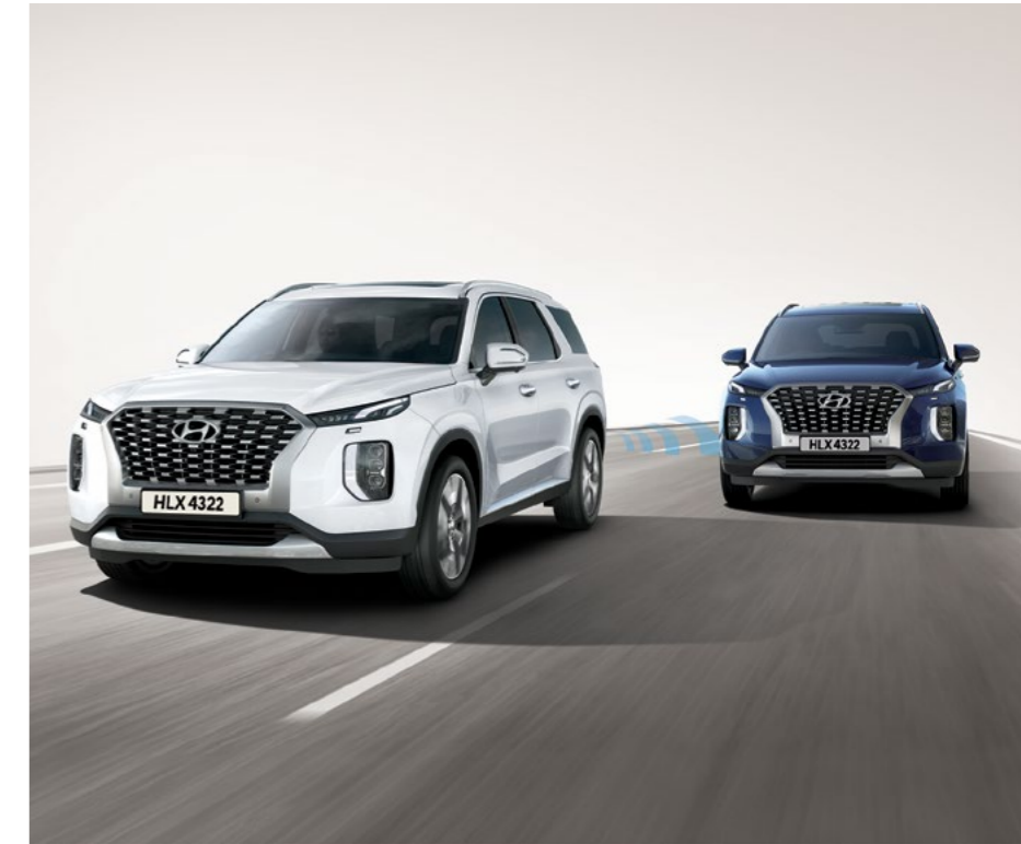
מערכת אקטיבית לזיהוי ומניעת התנגשות בכלי רכב ב"שטח מת" (BCA)

מערכת "יציאה בטוחה" המתריעה ומונעת פתיחת דלתות המושב האחורי במקרה של רכב חוצה.