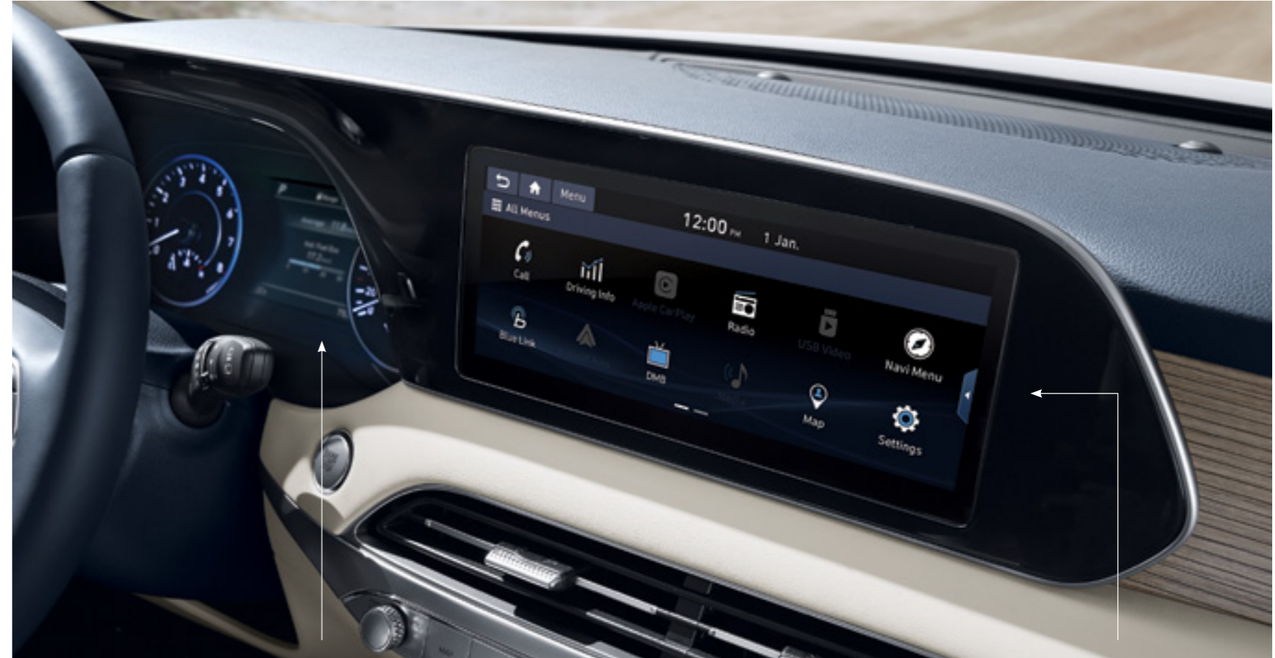
מחשב דרך צבעוני 7"