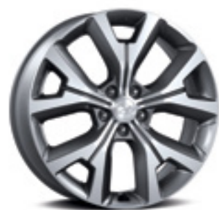
חישוק סגסוגת 20"