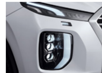
פנסים ראשיים מסוג LED