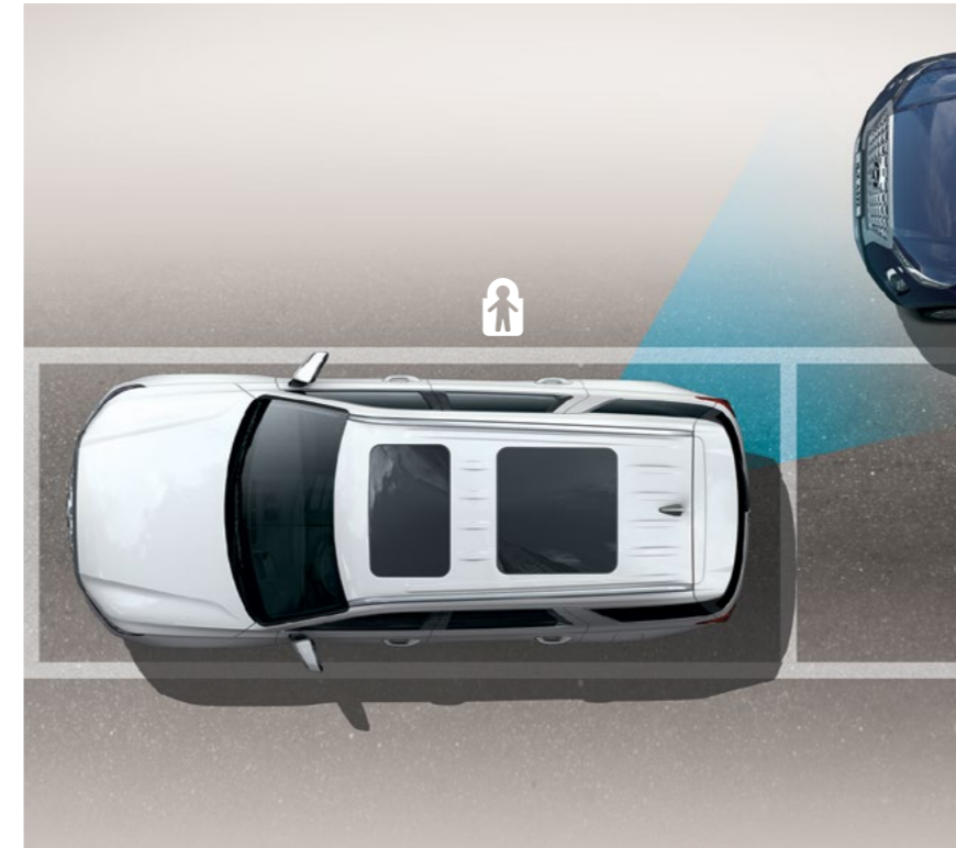
מערכת יציאה בטוחה מחנייה (SEA)

מערכת אקטיבית להתרעה ומניעת פגיעה ברכב חוצה בעת נסיעה לאחור.