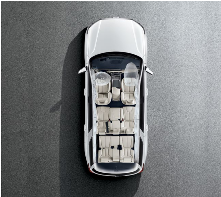
7 כריות אוויר

יונדאי פליסייד מצויד ב-Hyundai SmartSense, מערכות בטיחות מתקדמות המבוססות על טכנולוגיות הבטיחות האקטיבית העדכניות ביותר, כדי להעניק לכם יותר בטיחות ויותר שקט נפשי.