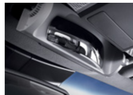
מראה פנורמית לפני הרכב